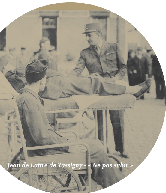
Jean de Lattre de Tassigny - « Ne pas subir »