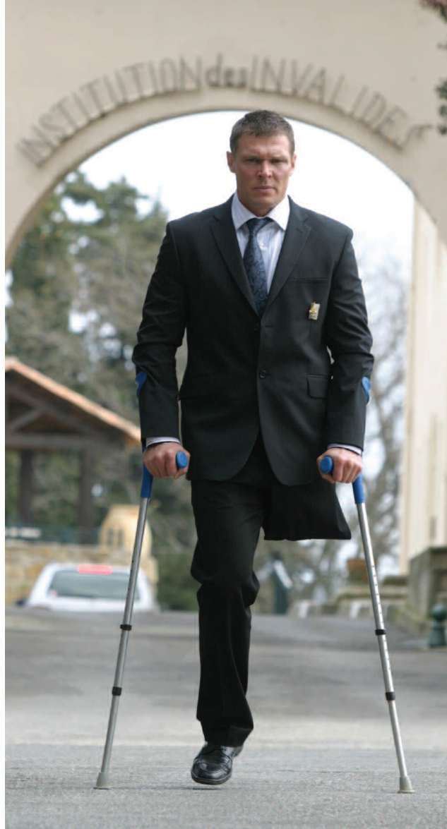
Magazine Képi blanc