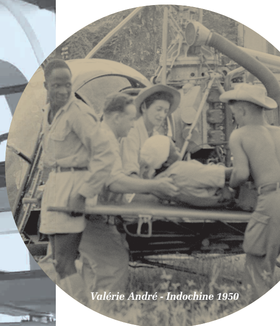
Valérie André - Indochine 1950