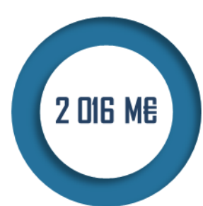
Crédits demandés PLF 2022 (en CP)