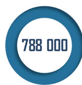
Participants aux JDC attendus en 2022

Les moyens alloués à la JDC par le programme 169 s'élèvent à 20,36 millions d'euros pour 2022, soit une augmentation de 2,54 millions d'euros, qui permettra principalement de prendre en compte la revalorisation de l'indemnité de déplacement versée aux participants. Ces crédits ne financent toutefois que les dépenses dédiées à la préparation et à l'organisation des journées , le reste des moyens étant issus de la mission « Défense » du budget de l'État, ce qui n'est pas source d'une parfaite lisibilité des crédits budgétaires consacrés à ce dispositif.