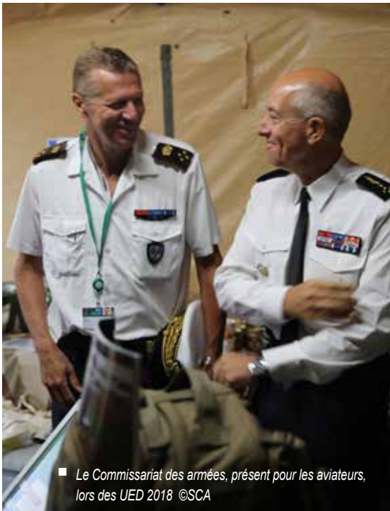
■ Le Commissariat des armées, présent pour les aviateurs, lors des UED 2018

pleinement intégrés dans le processus de planification et de conduite des opérations aériennes. À ce titre, ils détiennent une connaissance approfondie du milieu aéronautique et des processus opérationnels. Pour assurer cette mission, le SCA développe et entretient, en lien avec le commandement de la défense aérienne et des opérations aériennes (CDAOA), un vivier de LEGAD d'ancrage « air » capable de répondre au contrat opérationnel de l'armée de l'Air.