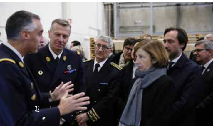
■ Le CRG2 Marcotte, Sous-directeur Numérique, le CRGHC PIAT, le Préfet et la ministre des Armées

L'ÉLoCANG illustre la modernisation du SCA et l'amélioration du service rendu aux militaires et aux unités soutenues. La mise en production de cette nouvelle plate-forme logistique coïncide avec l'arrivée d'effets nouvelle génération (tenue de sport renouvelée, gants de combat, sous-vêtements temps froid techniques, couteau de combat, d'assistance et de vie en campagne, nouvelle tenue de protection de base, etc.) dont elle va favoriser le déploiement rapide auprès des forces. Ce projet s'inscrit pleinement dans l'esprit de la LPM à hauteur d'homme, garantissant le financement des équipements du combattant et la modernisation des outils logistiques du