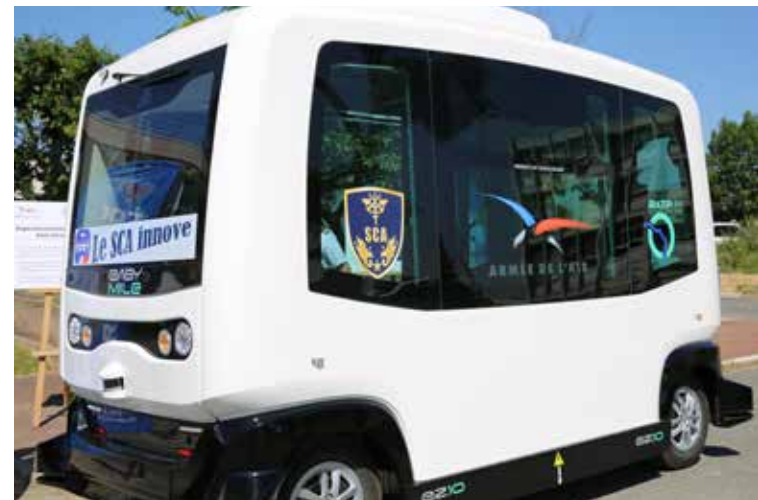
Expérimentation de la Navette Autonome Sans Chauffeur (NASC) sur la BA 107 de Vélizy-Villacoublay

Le GS d'Évreux par exemple, qui se trouve sur une emprise de 800 hectares, a officiellement lancé le