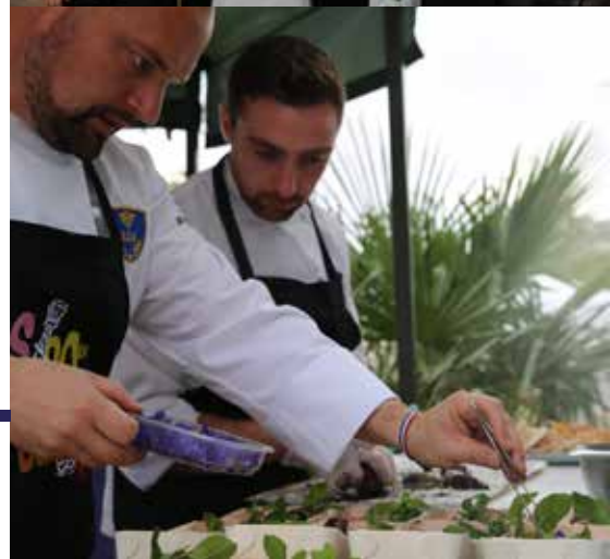
Rencontre avec le chef Thierry Marx, parrain de cette édition