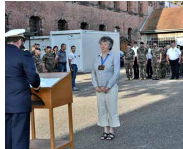
■ 28 juin 2019 : lecture de l'ordre du jour n°2 par le Chef du GS de Strasbourg-Haguenu