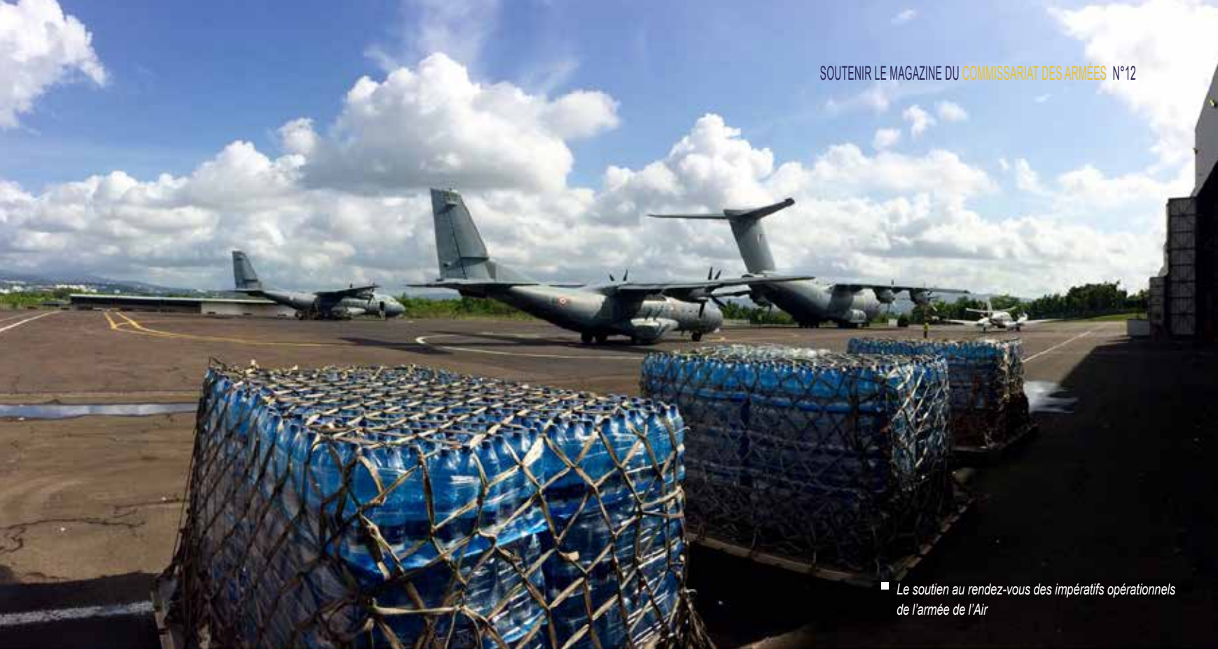
■ Le soutien au rendez-vous des impératifs opérationnels de l'armée de l'Air

pleinement intégrés dans le processus de planification et de conduite des opérations aériennes. À ce titre, ils détiennent une connaissance approfondie du milieu aéronautique et des processus opérationnels. Pour assurer cette mission, le SCA développe et entretient, en lien avec le commandement de la défense aérienne et des opérations aériennes (CDAOA), un vivier de LEGAD d'ancrage « air » capable de répondre au contrat opérationnel de l'armée de l'Air.