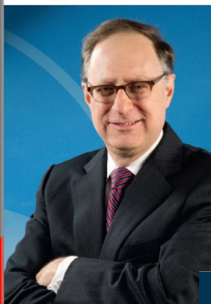
H.E. Alexander Vershbow