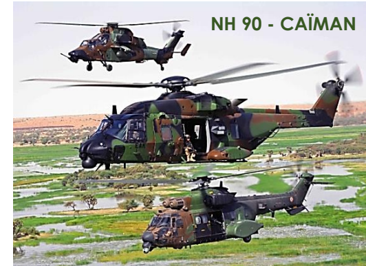
NH 90 - CAÏMAN