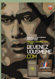
Recrutement de l'armée de Terre