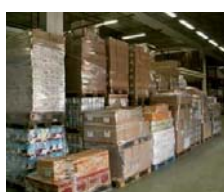
J-3 ou J-2 Réception et stockage des matières premières.