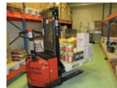
J-1 Sortie de stock des denrées nécessaires à la préparation des recettes.