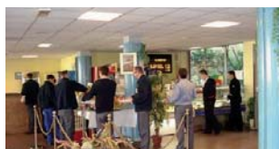
J+2 à J+13 Consommation (326 recettes sont consommables jusqu'à 9 jours après production, 57 jusqu'à 13 jours).