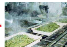
J Production : transformation et mise en barquettes.