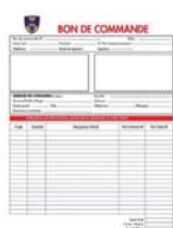
J-15 Validation des commandes.