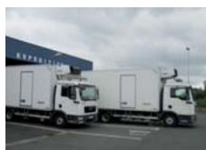
J+1 Expédition vers les restaurants.