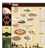
J-30 Envoi des menus aux restaurants abonnés.