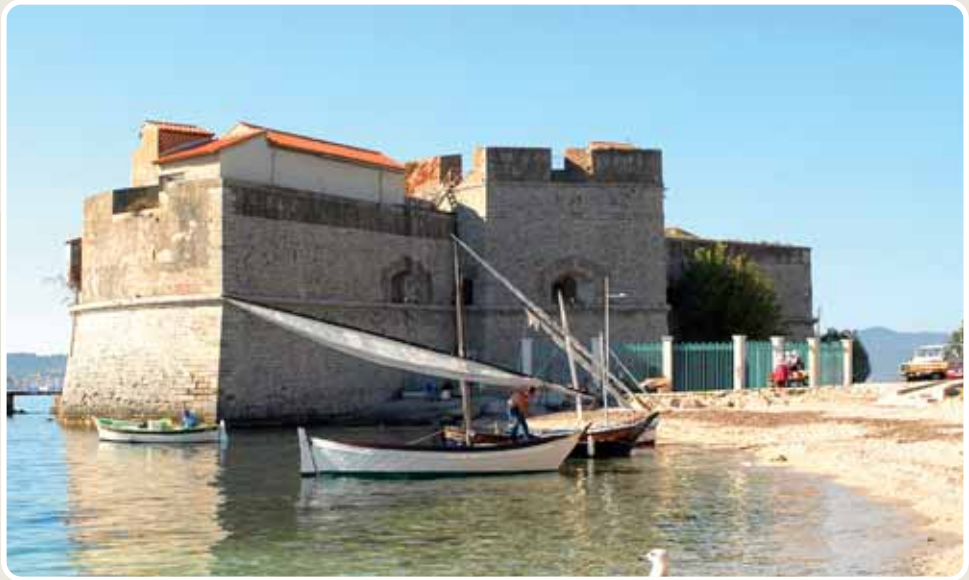
© Cercle de la BdD, Fort Saint-Louis, Toulon